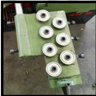
• Wire feeding system